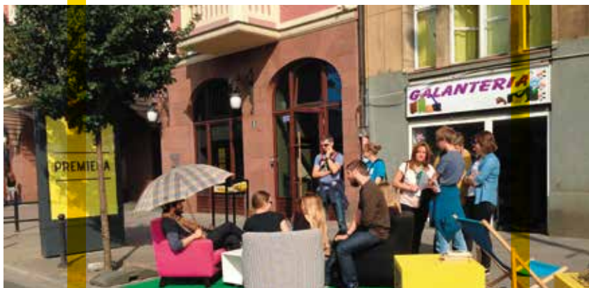
fol. materiały Teatru Nowego