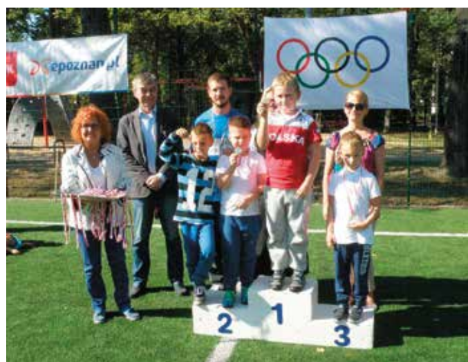
Tekst i zdjęcia: nauczycielka OJ nr 2